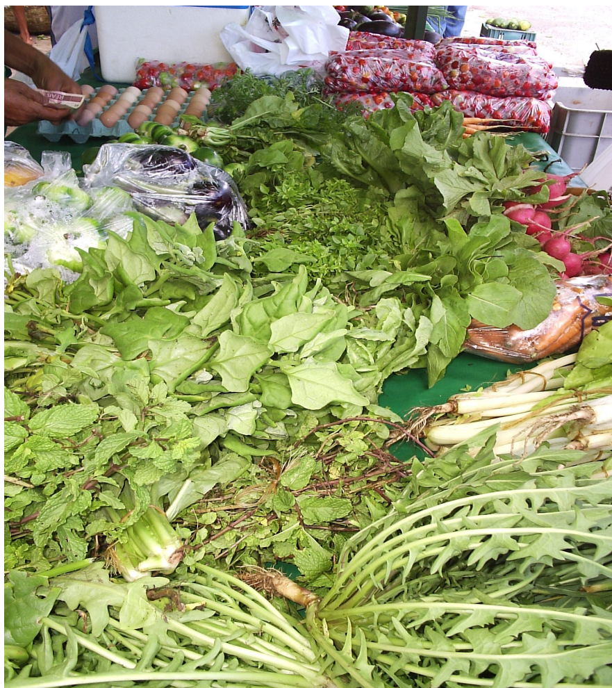
Produtos à venda – diversidade

Segundo um dos coordenadores da Feira, em entrevista para essa pesquisa: