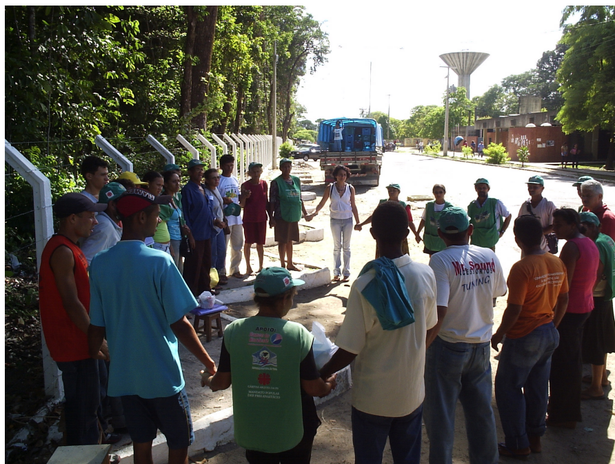
Final de feira – momento de acolhimento

A existência da Feira Agroecológica se dá a partir da organização do movimento de luta pela terra, por meio da Comissão Pastoral da Terra - CPT, da Igreja Católica. E mesmo reconhecendo o seu caráter econômico como fundamental, desde a sua origem, existem outras dimensões que acompanham a sua trajetória e a sua forma de organização. Os princípios que a embasam seguem um caminho compartilhado com os movimentos sociais populares na sua lógica de organização.