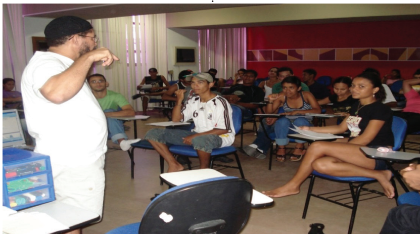
Curso de pesquisa-ação em empreendimentos solidários na INCUBES/NUPLAR (2007)

Essa dimensão da extensão possibilita a superação da alienação gerada pela não posse do produto do trabalho por parte de seus produtores, no modo de produção capitalista. Todos os produtores devem apropriar-se desse produto do trabalho, que é o saber.