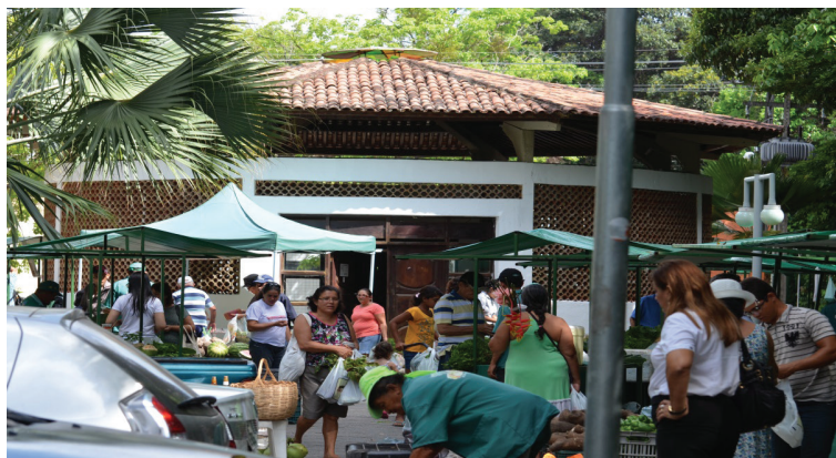
Projeto em Feira Agroecológica na INCUBES/NUPLAR (2008)

Esse direcionamento conceitual – extensão como trabalho social útil – é manifestado nos projetos analisados 30 . Convém ressaltar que os indicadores, em torno desta perspectiva, apresentaram percentuais elevados nos projetos CERESAT e Escola Zé Peão, particularmente entre os executores, com percentuais de 63% e 61%, respectivamente. Entre os coordenadores do Projeto Praia de Campina, atinge-se o percentual de 47% e 13% entre os executores. No Projeto Qualidade de Vida, essa concepção expressa-se entre os coordenadores com 13%, considerado, ainda um índice representativo.