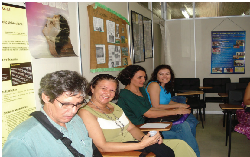
Pesquisa no Grupo EXTELAR/NUPLAR (2008)

Com o conceito de extensão considerado, a partir de agora, como um trabalho social útil, sua intencionalidade adquire um duplo viés: incrementar a indissociabilidade ensino e pesquisa e anunciar mudanças que venham combater a alienação. Dessa forma, a extensão constitui-se como um traço universal de todo o movimento, em que a sociedade, ao mesmo tempo que produz o homem, é produzida por ele. Na extensão, as outras atividades da universidade (o ensino e a pesquisa) são redimensionadas nessas bases. Trata-se de um trabalho que produz conhecimento e, também, o humano como indivíduo, bem como, os demais humanos.