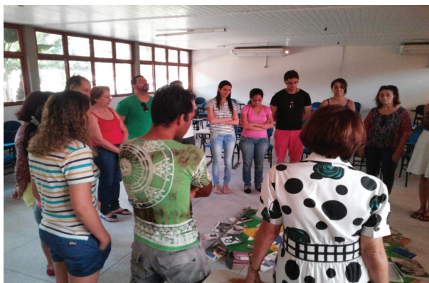
Curso de Especialização em Extensão e Economia Solidária (NUPLAR - 2016)

Na busca da modernidade, as ações educativas presentes na extensão popular voltam-se para uma ética dos fins e dos meios, resgatando-se a ética na política. Neste sentido é que se pode desenvolver o trabalho social voltado ao exercício da democratização de todos os setores da vida social, com a promoção da participação de todos os envolvidos em extensão, incentivando, inclusive, a educação aos direitos emergentes das pessoas.