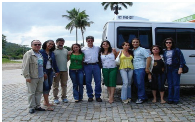
Doutorandos em Educação Popular, presentes na Usina Catende – PE. EXTELAR (2006)

vigentes geradas de manifestações que possam ser justificadas, pois do contrário não serão legítimas nem terão valor dialógico intersubjetivo. É, enfim, um fenômeno educativo pautado por uma pedagogia (metodologia) incentivadora da participação e do empoderamento das pessoas, com conteúdos e técnicas de avaliação processuais. Esse fenômeno é lastreado em uma teoria política direcionada aos anseios humanos de liberdade, de justiça, de igualdade e felicidade, além de estimuladora das transformações sociais necessárias.