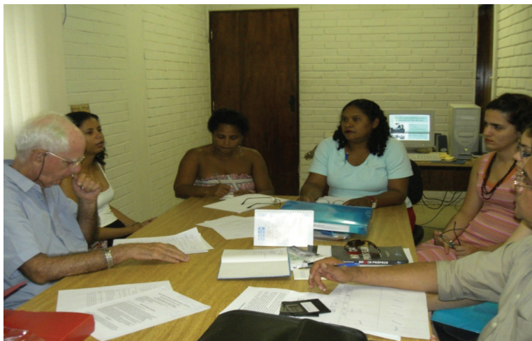
Atividades de pesquisa em projeto da INCUBES/NUPLAR (2006)

O que segue são trechos sintéticos e mais diretos aos conceitos das temáticas em evidência, já divulgados sobretudo em livro e artigos de revistas especializadas, podendo, inclusive, serem vistos isoladamente e fora deste texto.