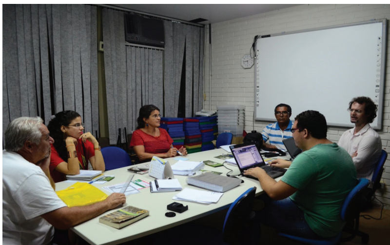
Preparando edição de livro com várias mãos – EXTELAR/NUPLAR (2016)

A Universidade Popular será uma instituição sem “sustos” com o novo século. Funda-se como uma aventura humana, conforme expressão de Cristóvão Buarque (1994), presente na odisseia da humanidade em sua existência. Assume expectativas do movimento docente nacional. Será uma universidade pública, gratuita, de qualidade socialmente referenciada. Será autônoma para poder desenvolver as mais diferenciadas pesquisas, democrática em suas relações internas e nas escolhas de dirigentes; será laica para garantir de que as diferentes religiões possam, inclusive, estar representadas nesse mundo escolar, desde que não queiram impor os seus credos religiosos. Será uma universidade crítica para garantir que o conhecimento não se torne mera repetição daquilo que se estabeleceu. Por tudo isso, será uma universidade popular por ser capaz de contribuir, com princípios éticos, para o desenvolvimento humano em bases tidas como populares.