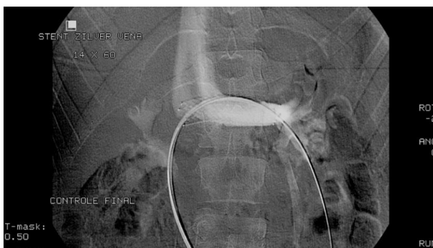
Figura 4. Stent posicionado corretamente em local de estenose.