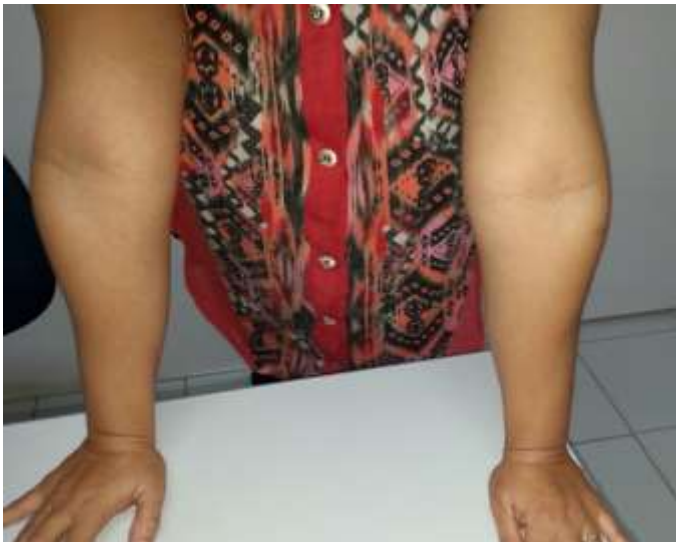
Figura 3 – Hiperextensão dos cotovelos maior que 10 graus. 2 pontos no escore de Beighton.