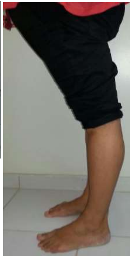
Figura 4 – Hiperextensão dos joelhos maior que 10 graus. 2 pontos no escore de Beighton.