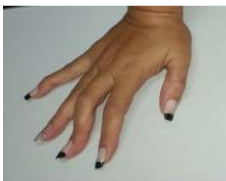
Figura 1 – deformidades digitais reversíveis em mão direita.

Paciente feminina, 34 anos, branca natural e procedente de João Pessoa/PB. Em novembro de 2013, foi encaminhada ao ambulatório de reumatologia do Hospital Universitário Lauro Wanderley (HULW) com quadro de artralgia em mãos e punhos. Nos antecedentes pessoais, referia histórico de dores articulares e subluxações, porém sem diagnóstico definido. Ao exame, dor à palpação de interfalangeanas proximais e metacarpofalangeanas, além de deformidades do tipo “pescoço de cisne” nos 2º, 3º e 5º dedos bilateralmente, corrigíveis em posição passiva (figura 1). Prosseguiu-se investigação diagnóstica para AJ. Exames laboratoriais mostraram hemograma, exames de função renal e hepática e complemento normais. Provas de atividade inflamatória, sorologias virais, fator reumatoide e anticorpo antinuclear negativos. Anticorpos anti-citoplasma de neutrófilos, anticorpos antipeptídeos citrulinados cíclicos (Anti-CCP), Anti-RO, Anti-Sm, Anti-DNA ds e HLA-B27 também negativos.