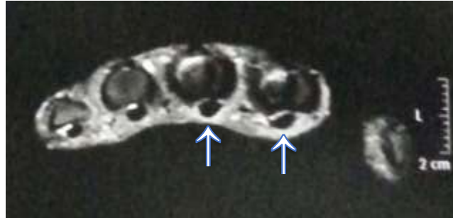
Figura 2 – Tênuas áreas de hipersinal (setas brancas) nas imagens ponderadas em T2 adjacentes aos tendões flexores do 2º e 3º metacarpos, achados que podem estar relacionados à áreas de processo inflamatório (tenossinovite).

melhora com anti-inflamatórios não hormonais, foi iniciado prednisona (5mg/dia) e sulfato de hidroxicloroquina (400mg/dia). Com o acompanhamento, observou-se ao exame físico sinais de hiper mobilidade em mãos, punhos, cotovelos e joelhos (figuras 3 e 4)